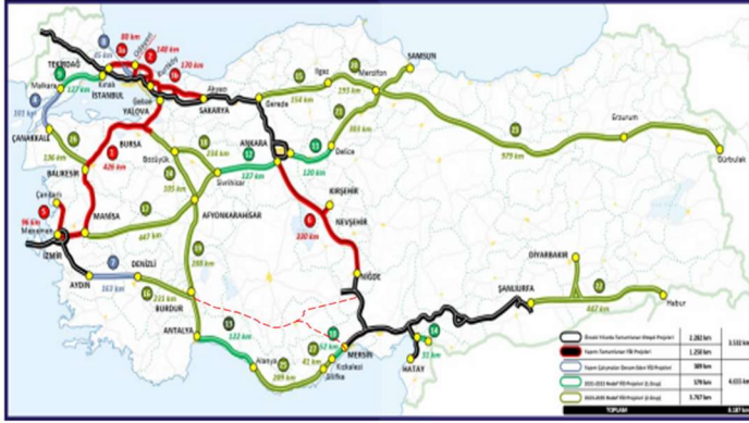
Harita 4. 2035 Otoyollar

2.2. Irak-Türkiye Kalkınma Yolu (KYP) gündemde değilken (2005 yılında) planlanan Otoyollarda değişmesi gereken veya eksik olan güzergahlar aşağıda 4 No' lu haritada ve ön hazırlıklarına hızla başlanması gereken Trabzon-Şırnak otoyolu 5 No'lu haritada gösterilmiştir.